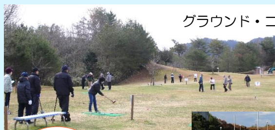
グラウンド・ゴルフ大会