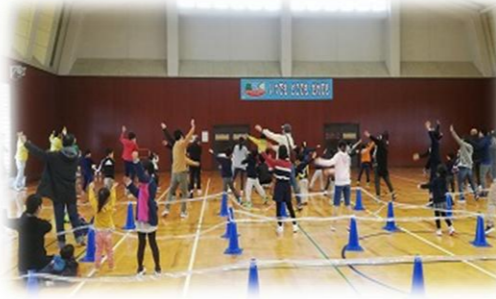
誰でも いつでも 世代を超えて 好きなレベルで いろいろな スポーツを